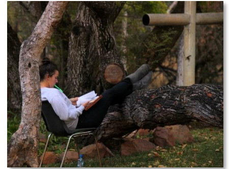
Oggendstilte in die natuur was baie spesiaal vir ons.