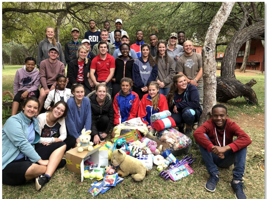
Limpopo Landsdiens het kombersies, speelgoed en kos ingesamel vir Chukudu Wildlife Rehab Centre.