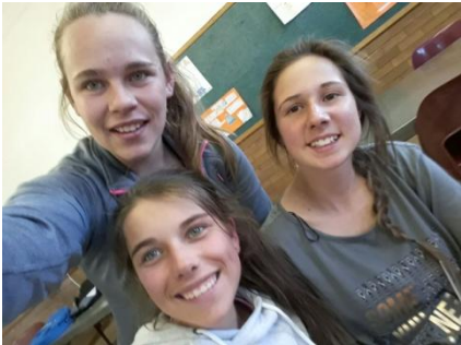
Die Junior Landsdieners het gehelp met die voorbereidings van die matriekafskeid.