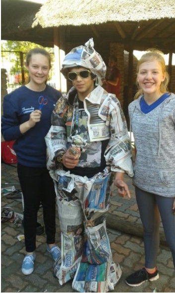
Hulle het klere ontwerp uit koerantpapier en dit vertoon. Kreatiewe uitrustings is gemaak.