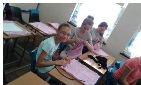
Op 21 Augustes het Laer Volksskool se Landsdieners hulle eetgerei-sakkies versier. Hulle het hulle hande geverf en op die sakkies gedruk. Daarna het hulle 'n randpatroon met duimafdrukke gemaak.